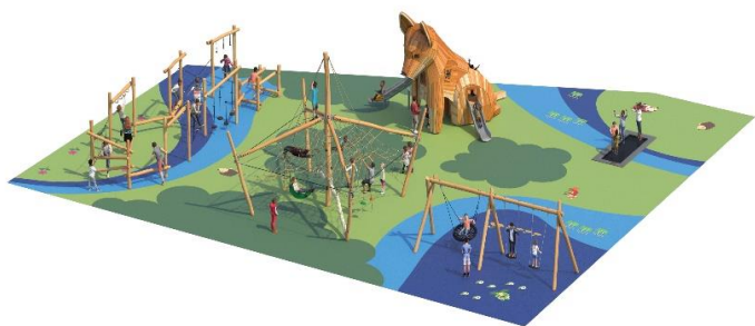
3D de la future aire pour les grands

Les plus petits pourront jouer dans deux maisons-champignons, et s'amuser dans le terrier de renard ou sur l'abeille géante. Quant aux grands, c'est un renard de 5 mètres (en référence aux sculptures plébiscitées par les habitants lors de la première concertation numérique) qui surplombera les balançoires inclusives, le parcours d'agilité et la toile d'araignée.