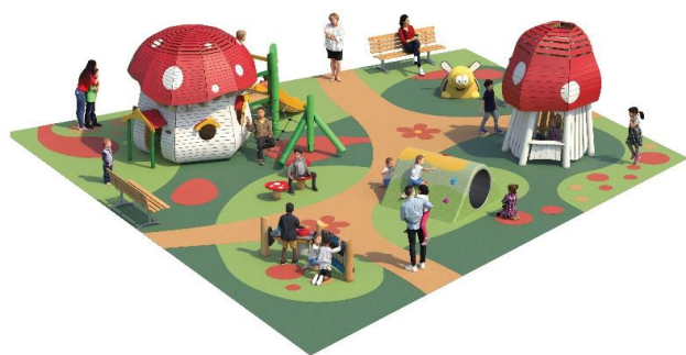
Vue3D de la future aire pour les petits