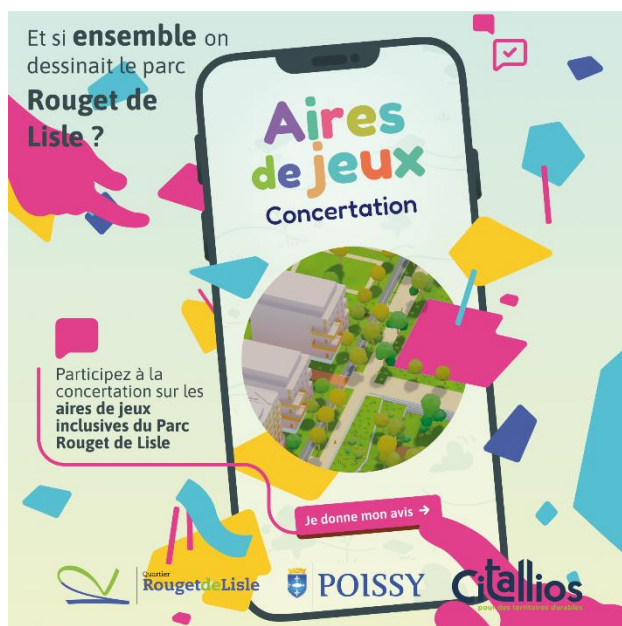
Modélisation 3D du candidat Kompan et Flyer pour annoncer la concertation