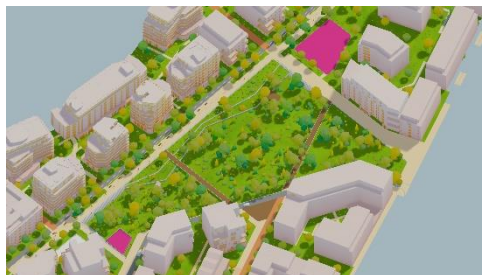
Emplacement des aires de jeux inclusives – 1001rues

Dans le cadre de l'aménagement de l'écoquartier, CITALLIOS en lien avec la Ville de Poissy, a organisé, à l'été 2023, une concertation numérique pour sélectionner les futures aires de jeux inclusives du parc. Cette concertation, conçue et développée par la start-up 1001rues, compte pour 20% dans l'analyse des offres des candidats.