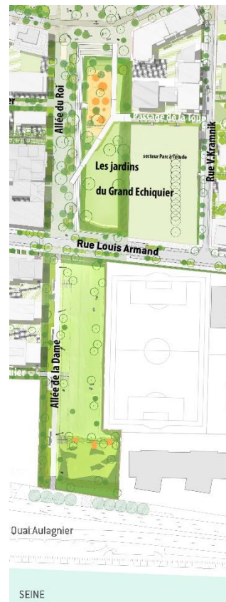
Plan masse des Jardins du Grand Échiquier, de sa future extension et du parc Maxime Vachier-Lagrave.

« Le rapport visuel et géographique à la Seine a été notre première source d'inspiration : le parc se prolonge au sud jusqu'au Quai Aulagnier, et même si aujourd'hui ce quai n'est pas encore aménagé pour la promenade, il était important dès maintenant d'envisager cette continuité entre un parc de quartier et ce paysage fluvial et urbain remarquable. Nous avons voulu privilégier les surfaces libres (pelouses arborées, prairies) capables d'accueillir des usages multiples et surtout de mettre à disposition des habitants de grands espaces plantés et rafraîchissants dans un contexte urbain minéral. » Florence GUENNEC, de l'Agence TER, concepteur du parc urbain.