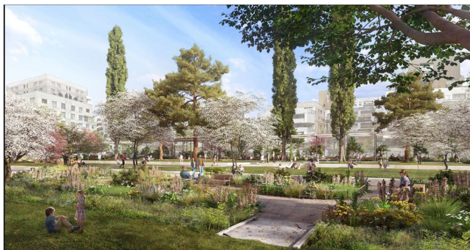
Future extension des Jardins du Grand Échiquier

seulement le nombre d'arbres présents sur le site, mais aussi d'augmenter la capacité du parc initial à 1,2 hectares.