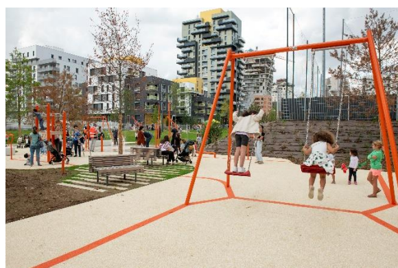
Nouvelle aire de jeux