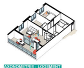
AXONOMETRIE - LOGEMENT