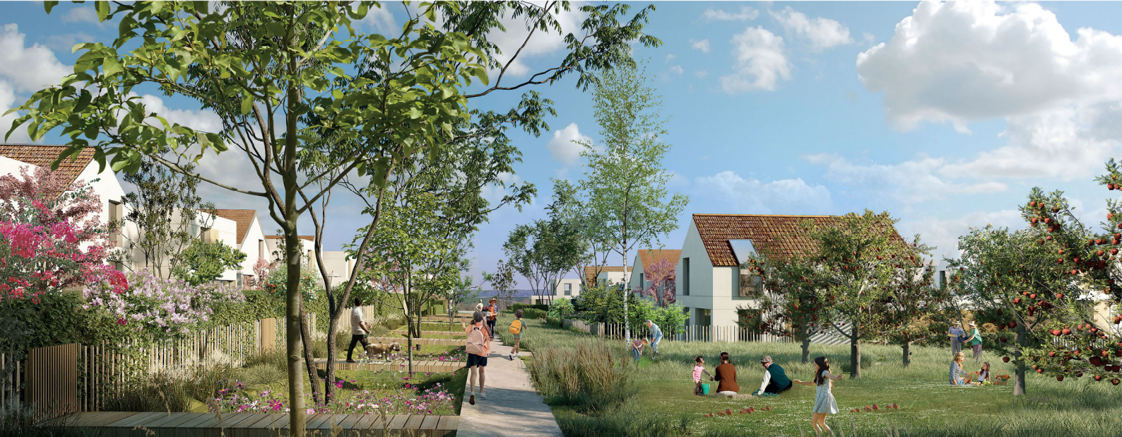
PERSPECTIVE DEPUIS LA COULÉE VERTE - COUVERTURE VERS LE PAYSAGE AGRICOLE