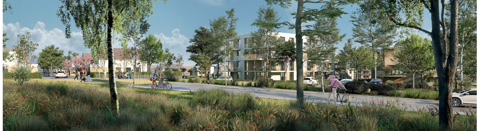
PERSPECTIVE SUR ENTREE DU NOUVEAU QUARTIER DEPUIS LA PISCINE