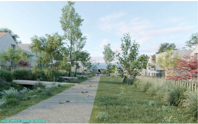
COULÉE VERTE ET JARDINS DES MAISONS