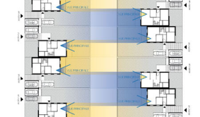
PLAN DES MAISONS