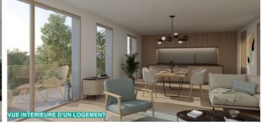
VUE INTERIEURE D'UN LOGEMENT