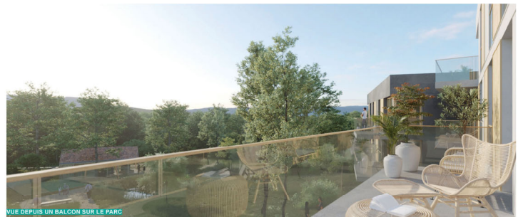
VUE DEPUIS UN BALCON SUR LE PARC