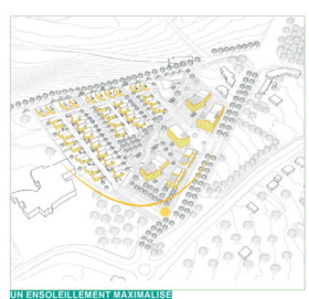
UN ENSOLEILLEMENT MAXIMALISE