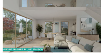
VUE INTERIEURE D'UNE MAISON