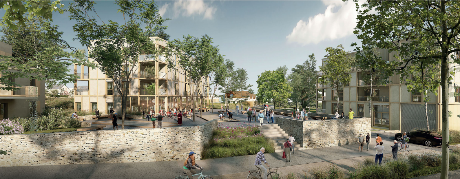
PERSPECTIVE SUR LA PLACE BELVEDÈRE - OUVERTURE VERS LE CENTRE HISTORIQUE