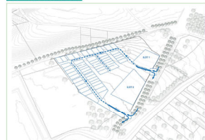
DOUCAGE ET MOBILITÉS DOUCES