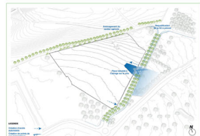
REGUALIFICATION DES VOIES