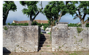
EN TRANSITION ENTRE VILLE ET CAMPAGNE

De la Place du village au chemin vicinal : comment faire quartier ?