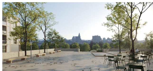
PERSPECTIVE DEPUIS LA PLACE BELVEDÈRE VERS LE CENTRE HISTORIQUE