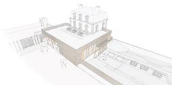
© Atelier de L'Île – Illustrations non contractuelles à caractère d'ambiance

Sous la conduite de CITALLIOS en concertation avec la ville de Clichy-la-Garenne, cet ambitieux projet architectural et paysager sera piloté par le groupement de maîtrise d'œuvre constitué d'Atelier de l'Île Architectes, CIEL Architectes, Parica International, Choreme, P-Trema et Altia. Ce dernier a été retenu après une procédure de dialogue compétitif ayant permis à trois groupements de faire des propositions.