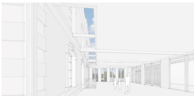
© Atelier de L'Île – Illustrations non contractuelles à caractère d'ambiance

Le centre de loisirs sera constitué d'une grande halle et de nombreuses salles d'animations (plus de 700 m 2 de surface de plancher), et d'un jardin pédagogique de plus de 500 m 2 .