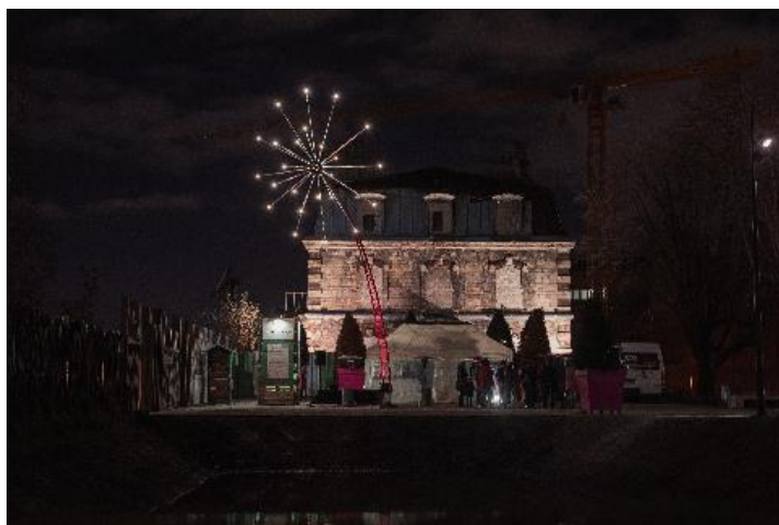
Mise en lumière de la Maison du régisseur à l'occasion du Jardin d'Hiver, illuminations du Parc des impressionnistes jusqu'au 31 janvier 2022

La Maison du Régisseur accueillera ainsi, à partir de 2023, une centaine d'enfants âgés de 6 à 12 ans encadrés par une douzaine d'animateurs, au cœur du parc des Impressionnistes.