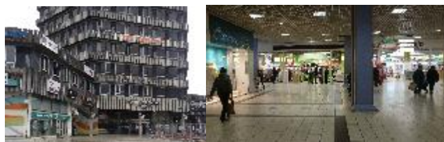
Le Centre des Nations – la façade principale et la galerie commerciale

Pour renforcer son accompagnement aux projets de rénovation urbaine, l'ANRU a souhaité faire appel à une large gamme de compétences extérieures dans des champs disciplinaires variés mais nécessaires à la conduite des projets de rénovation urbaine du fait de leur ampleur et de leur complexité opérationnelle. CITALLIOS (ex-SEM 92), mandataire d'un groupement avec le cabinet Cushman & Wakefield, a été retenue sur le champ disciplinaire intitulé « La rénovation urbaine et le développement économique et commercial ».