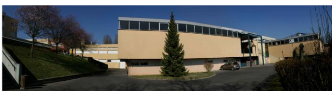
ETAT EXISTANT ..... PERSPECTIVE SUR FACADE GLO DU BÂTIMENT PRINCIPAL