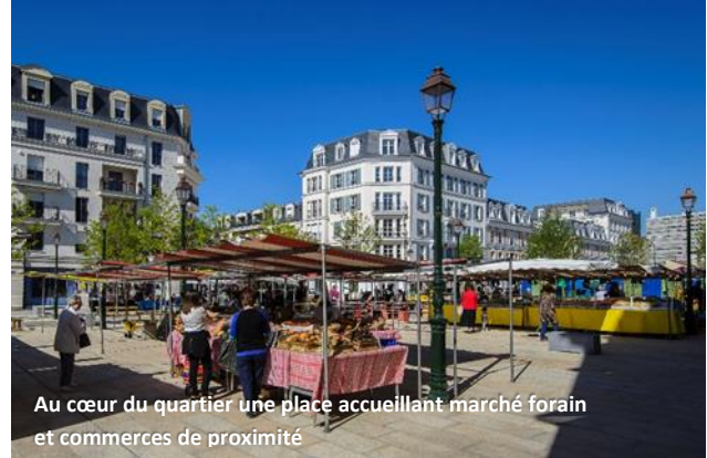
Au cœur du quartier une place accueillant marché forain et commerces de proximité

Concession d'aménagement confiée de 2005 à 2013 par la ville de La Garenne-Colombes ET Assistanes à maîtrise d'ouvrage confiées en 2013 DURÉE : 8 ans et 2 ans /// BUDGET : 296 M€ TTC