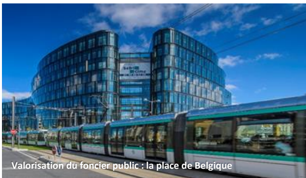
Valorisation du foncier public : la place de Belgique

Une importante stratégie de communication organisée autour d'une structure d'accueil des habitants et une maquette 3D a été le support d'une information permanente tout au long du projet.