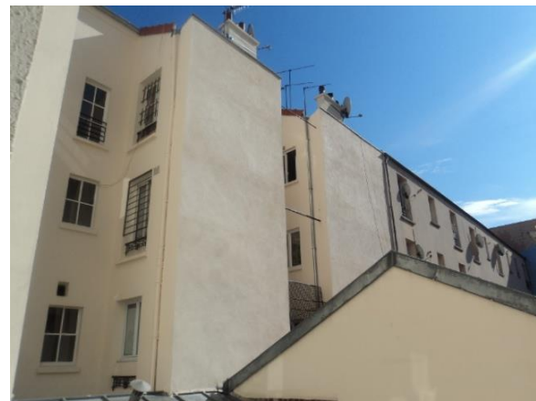
Assistance à maîtrise d'ouvrage confiée en 2008 par la ville de Clichy-la-Garenne