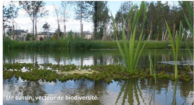
Un bassin, vecteur de biodiversité

Opération réalisée dans le cadre de la Concession d'aménagement confiée en 2002 par la Ville de Clichy-la-Garenne DURÉE : 3 ans/// BUDGET : 16 M€ TTC