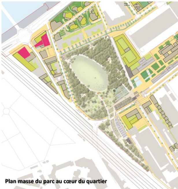
Plan masse du parc au cœur du quartier

Le parc des Impressionnistes est le premier équipement public créé dans la ZAC du Bac d'Asnières à Clichy. Réalisé sur une friche, occupée par les gazomètres de l'usine de gaz jusque dans les années 70 et situé sur des remblais du XIX ème siècle à 6 m au-dessus du niveau du quartier, il a transformé l'image industrielle du quartier.