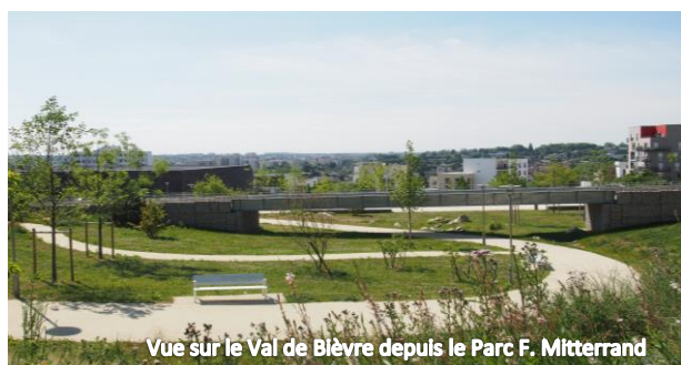
Vue sur le Val de Bièvre depuis le Parc F. Mitterrand

La SEM 92 a par ailleurs mis en place un dispositif participatif (jury citoyen) pour le choix des projets architecturaux relatifs aux programmes de logements neufs impliquant les habitants du quartier et de Bagneux