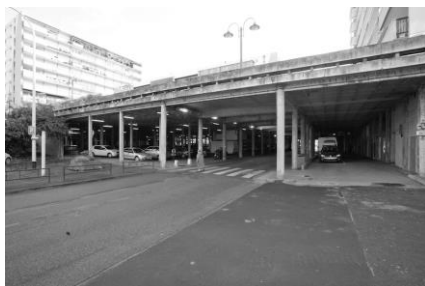
Le quartier Louvois en 2014