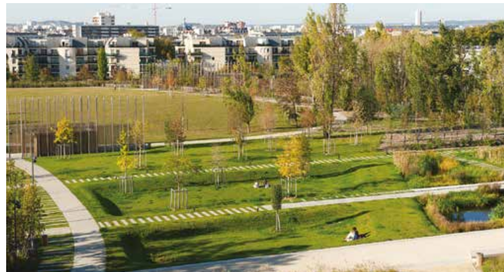
Un quartier qui s'installe autour du Parc des Impressionnistes

Le ministère et ses partenaires accompagnent la Collectivité dans l'évolution du projet.